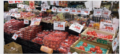
オオセキ 下北沢店 外観と品ぞろえ豊富な商品棚